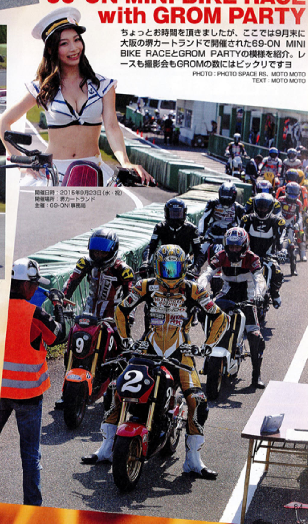
開催日時: 2015年9月23日(水・祝) 開催場所: 堺カートランド 主催: 69-ON!事務局

TEXT: MOTO MOTO